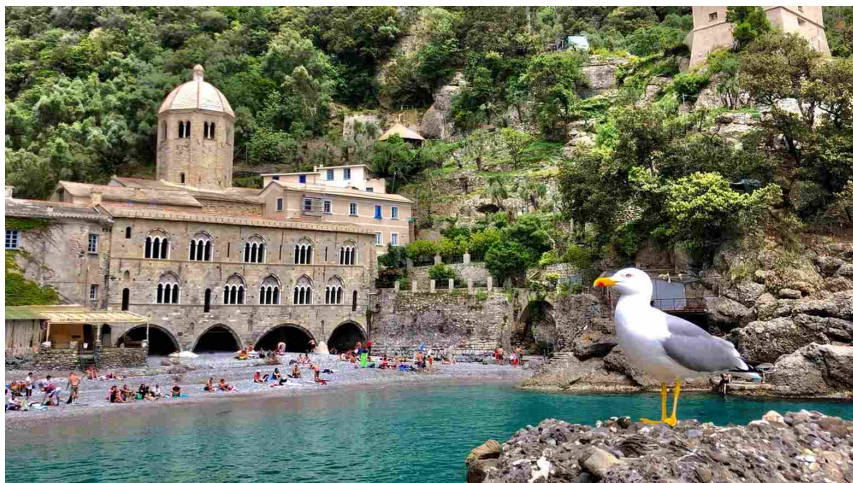
L'abbazia di San Fruttuoso a Camogli